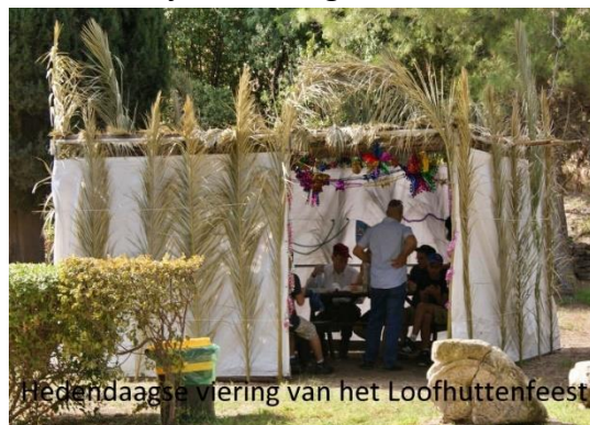
Hedendaagse viering van het Loofhuttenfeest

Het Loofhuttenfeest heeft een dubbele betekenis. Aan de ene kant markeert het het einde van de oogst en is dus een dankfeest. Aan de andere kant is het de herinnering aan de woestijnreis vanuit Egypte naar het Beloofde Land. De loofhutten symboliseren dan de kwetsbaarheid en de afhankelijkheid van de mensen. De maaltijden worden in de hutten gegeten. Het dak van de hut moet de mogelijkheid bieden om de sterrenhemel te zien. Er moet als het ware zicht zijn op God. Er worden elke dag offers gebracht en er zijn lezingen uit de wet.