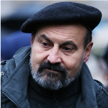
Tomáš Halík, Niet zonder hoop